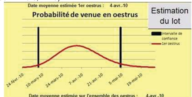
Figure 3 Exemple d'estimation des dates de venue en chaleurs obtenue à partir des dates de vêlages (17 janvier au 14 mars, n=25).

Un premier module permet d'alerter l'éleveur sur les périodes où il est nécessaire d'accroître la vigilance pour détecter les chaleurs des divers lots qui composent son troupeau (Figure 3). Un second module permet de mettre en évidence les facteurs influençant l'intervalle vêlage – reprise de cyclicité moyen du troupeau et ainsi de proposer des modifications de pratiques. Il s'agit par exemple de simuler l'effet d'une variation d'état corporel au vêlage ou d'un décalage de la période de vêlage sur la reprise de cyclicité, et donc sur les venues potentielles en chaleurs. L'utilisation de cet outil est pour le moment limitée aux troupeaux de race Charolaise (Blanc et Agabriel, 2008) mais sera prochainement validé sur les autres races allaitantes.